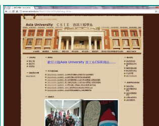
圖說：網站設計組第二名的作品「創意資工設計網」，在網路上擁有高人氣。