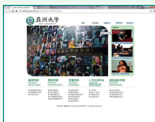
圖說：網站設計組第一名的作品「AmberAsia」，以微笑牆展現亞洲大學親和力。